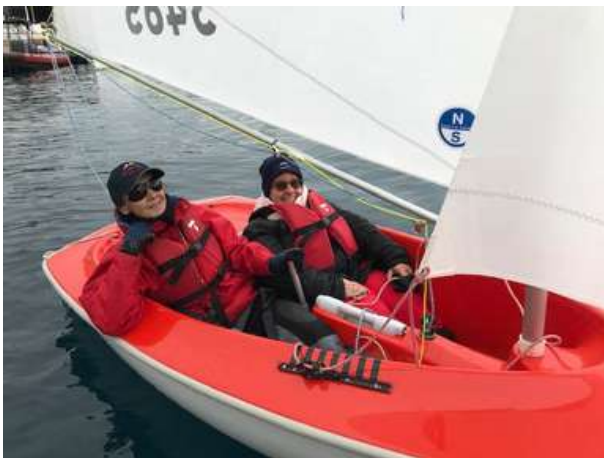
Entraînement de voile

Parmi ces rendez-vous figurent notamment des pique-niques, des tournois de pétanque ou encore le traditionnel repas de Noël, autant d'occasions de se réunir, de célébrer ensemble et de favoriser la participation de tous dans une atmosphère chaleureuse et inclusive.