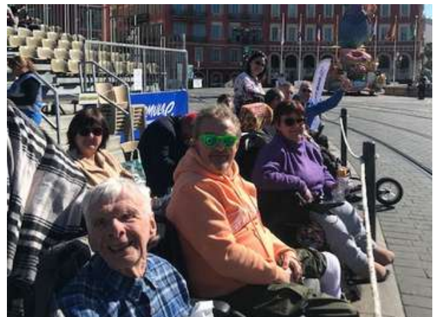
Bataille de Fleurs à Nice

Vous pouvez suivre l'actualité de l'A.M.H.M.