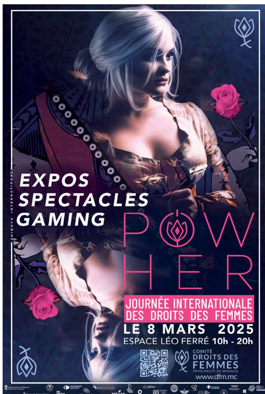
Affiche du Comité pour l'année 2025

Programme à venir, surveillez le Monaco Matin et vos réseaux sociaux.